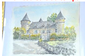
Aux couleurs du temps