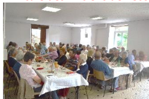
L'Amicale des Anciens de l'école